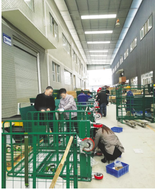
●成都百德公司管理人员到生产部赶装笼车

灯夜战，保证上万张图纸按时下单；生产部各个车间调整作业时间，以客户要货时间倒计时安排加工作业，把一天当做两天用，夜以继日，歇人不歇机器，加班人员吃住都在公司，放弃周末和中秋、国庆节，他们说我们要以实际