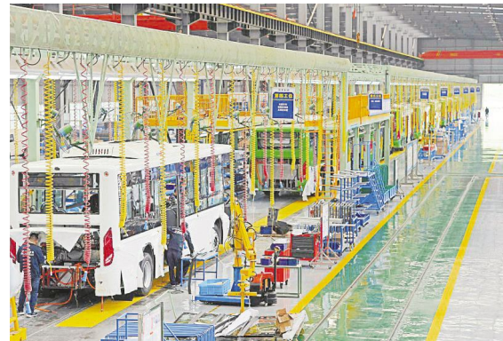
●雅安芦天堡飞地产业园区内四川新筑通工汽车有限公司的的新能源公交车生产线。

共建产业园区，甘眉(川粤)、广安-深圳、嘉兴-宜宾和规划建设的佛山-凉山等4个东西部产业协作园区，以及川港、海峡两岸和正在规划建设建设的川桂等3个国际协作园区。