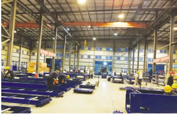
●成都百德公司员工加班赶装皮带输送机