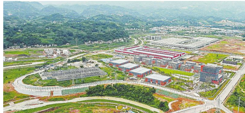
●雅安芦天堡飞地产业园区。

截至目前，全省已建成和规划建设的省际飞地产业园区共10个。包括邻水装备制造、华蓥电子信息、武胜农产品加工等3个川渝合作