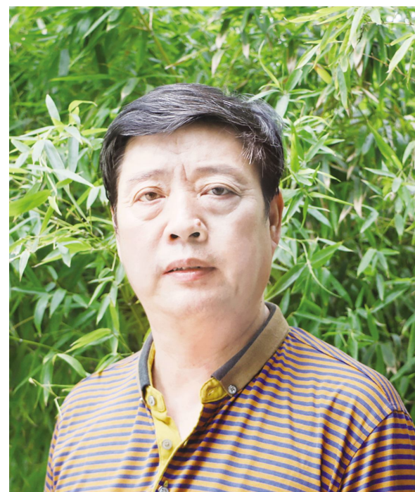
艺术财富传承人——王永春

现兼任全国政协常委委员,全国政协书画室副主任、国家文物局出版社社长、中国书协中央国家机关分会副会长、中央国家机关书画协会主席、中国书法家协会理事、中国文物保护基金会副会长、中国老年书画研究会会长、中国书画收藏家协会会长、中国书协评审委员会委员、中国教育学会书法教育专业委员会理事长、中国书法培训中心教授、艺术品中国网资深顾问。作品参加2011年8月23日在中国革命军事博物馆开幕的“光荣的使命——全国新闻出版行业书画展”。