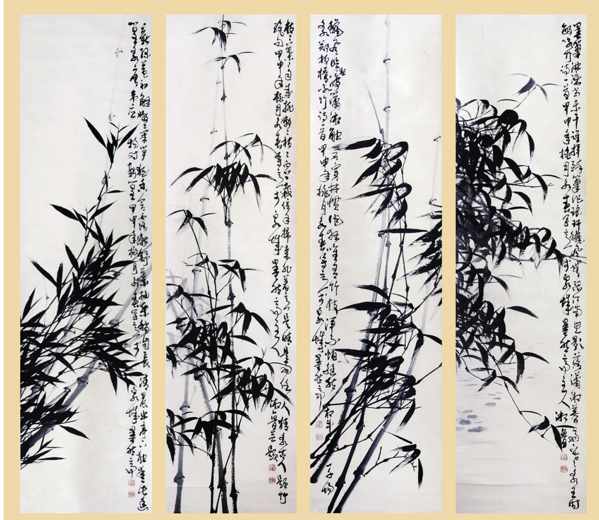
王永春作品《嫩寒春晚,潇湘细雨,竹韵临风,影落潇湘》