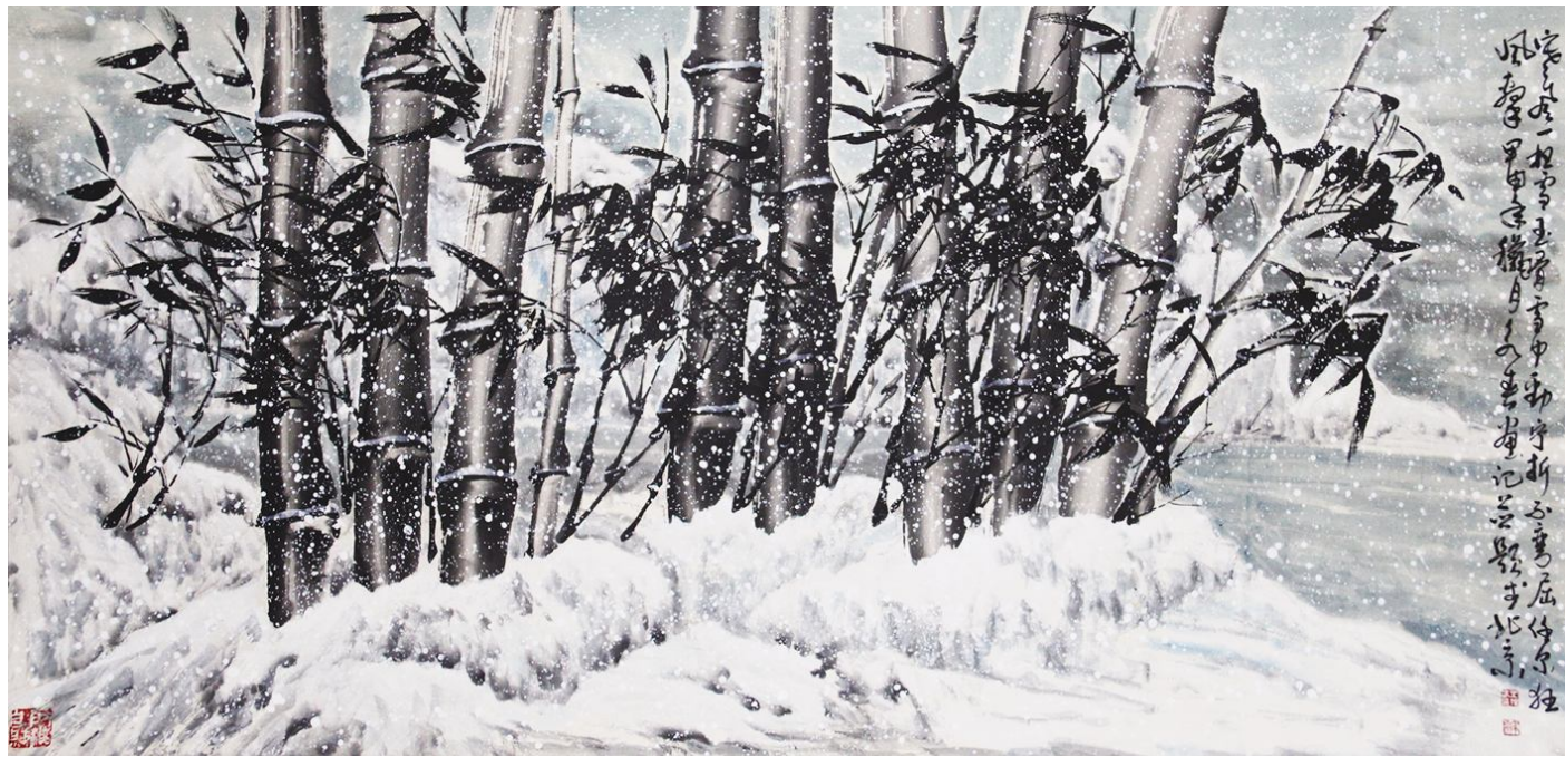
王永春作品《铁骨傲雪》规格:117cm×244cm

作品及传略分别编入《世界当代著名书画家真迹博览大典》《二十世纪中日书画名匠集》《山东书画家名录》等十几部大型辞书。2017年10月31日参加由中国艺术报社、中国企业文化促进会、企业家日报社、中企报盟信息科学研究院共同在中国文联文艺家之家展览馆举办的“庆祝十九大·不忘初心跟党走”——企业优秀书画作品展活动并获得入展证书。