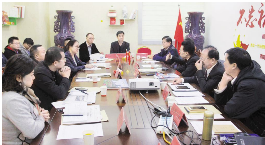
险经纪服务、养老服务、健康管理、教育咨询、物联网技术开发、社区基础设施维护、文化艺术交流等37个行业。中科佳建设(深圳)有限公司、深圳弘益建生

百家社区服务有限公司是经国家工商总局核准通过并合法注册的全国性社区专业服务机构,招商中心在北京市大兴区国家高新技术开发区内,网络技术中心在西安,运营中心在洛阳,经营范围包含家政服务、法律咨询、保