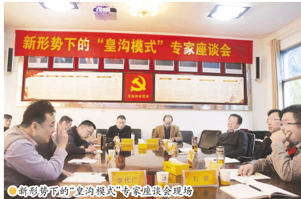
● 新形势下的“皇沟模式”专家座谈会现场