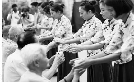
大华国际茶文化进社区活动