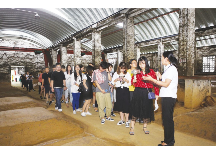
●媒体记者参观观池