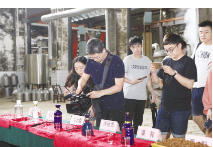
●稻花香产品深受媒体关注