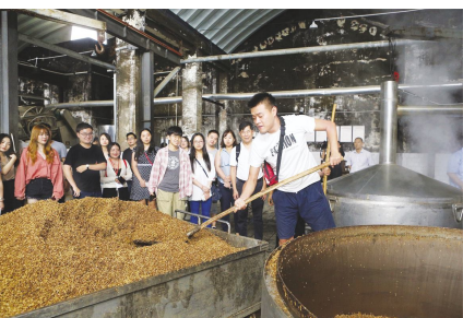
●媒体记者现场体验上甄