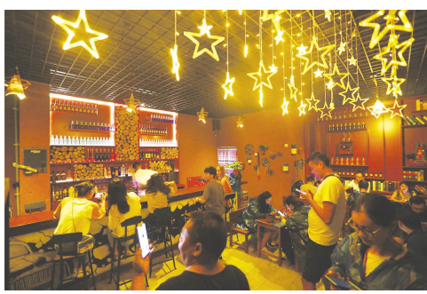
●古镇巷往酒吧轻松一刻

味,媒体记者们争相体验欢乐城的多彩活动。在欢乐城消耗了体力的媒体记者们循着味儿,就能找到古镇内的特色商铺,来一碗西施豆腐坊的招牌豆花,一瓶“叭一口”现打酸奶,