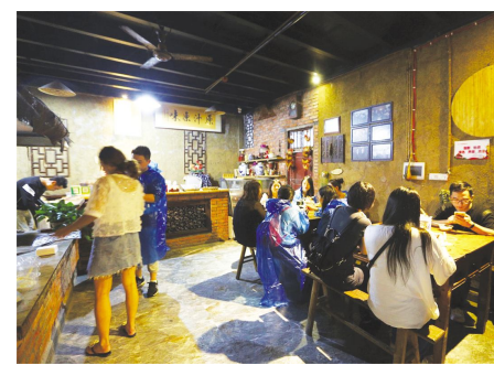
●古镇西施豆腐坊品尝美味

来到即将正式开业的鼠蜀泰欢乐城,媒体记者们一下欢呼雀跃起来!设施齐全的射击馆,引得众人纷纷上阵弯弓搭箭;进入3D森林馆,一个梦幻的童话世界引得大家争相合影留念,上演了一场多姿多彩的漫画秀;还有精武门武术馆、童趣的考拉馆等,各有特色,别有趣