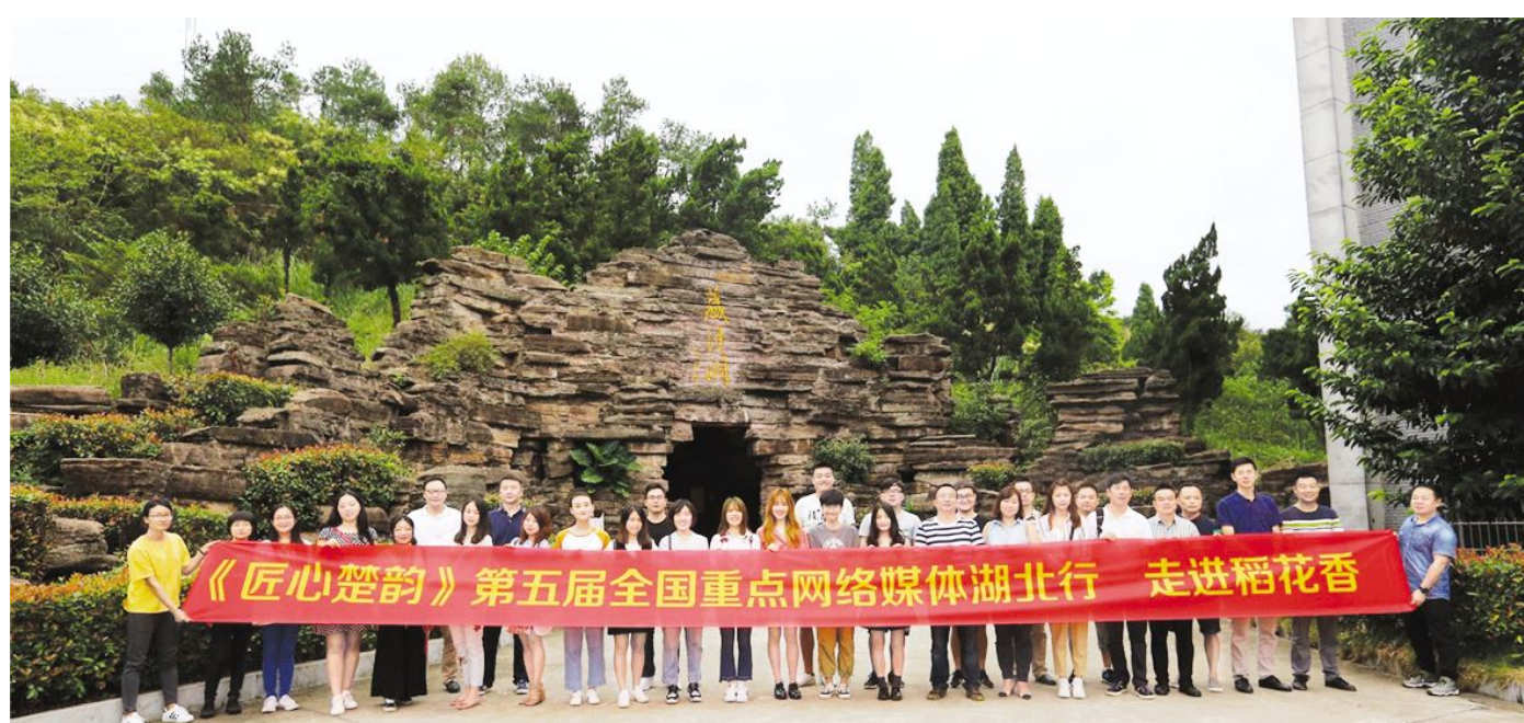
●媒体记者在藏酒洞前留影

据了解,“2018匠心楚韵·第五届全国重点网络媒体湖北行”由荆楚网(湖北日报网)主办,旨在以新媒体视角,借力微博、微信、微视频等全媒体手段,展现湖北知名企业的发展硕果,传递湖北地方品牌文化正能量。中国经济网、中国日报网、光明网、腾讯网、新浪湖