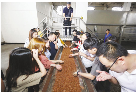
●与糖化料亲密接触