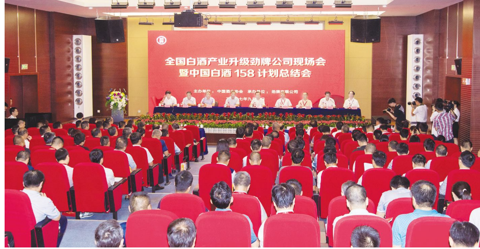
●中国白酒158计划总结会

励大会上,劲牌主导完成的“保健酒现代制造关键技术及产业化”项目荣获2016年湖北省科技进步一等奖。据了解,这是近年来湖北首个由酒企牵头获得的省科技进步一等奖。