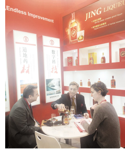
●参加2017年德国杜塞尔多夫ProWein展会

造性是生产力发展的动力和源泉。离开了人,生产力就失去了内涵。劲牌坚持“以人为本”的理念,尊重员工、关爱员工、培育员工,为员工提供温馨、和谐的工作、生活环境,提供良好的发展平台,同时,劲牌也因此打造了一支能征善战、团结向上的团队,他们不忘初心,勇往直前,为劲牌实现使命而不断地努力奋斗,从而促进了劲牌的生产力。