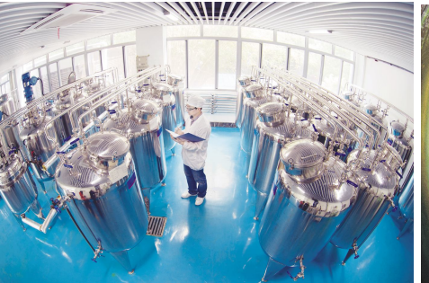
●保健酒中试实验室