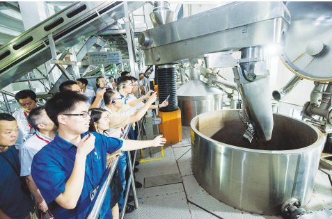
●消费者参观生产车间