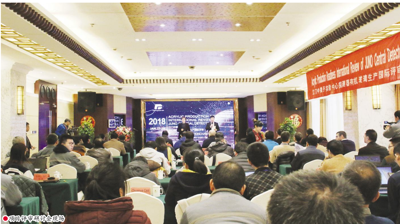
●项目评审研讨会现场

本报讯 经过为期近一年时间的研发攻关,1月28日,由泰兴汤臣压克力有限公司承建的用于中微子探测器核心部件的玻璃球体项目,经过两天的现场检测、技术研讨,顺利通过了国际专家组评审,标志着全球最大的压克力球体项目将进入正式生产阶段。中科院高能物理研究所所长王贻芳、中科院副秘书长张坤,以及40多名来自我国、加拿大、美国、意大利的物理学专家齐聚江苏泰兴参加评审活动。