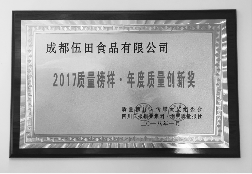
●“2017 质量榜样·年度质量创新奖”