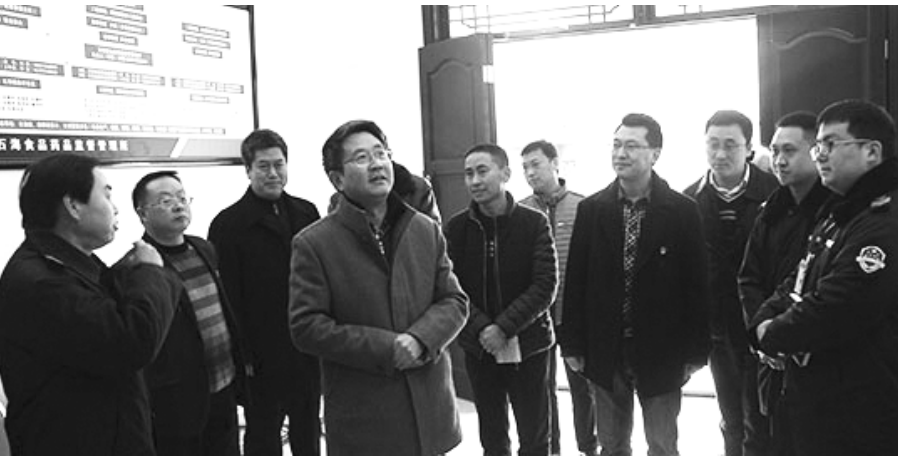
●鞠波(中)一行深入兴文县实地察看调研

鞠波对兴文县高度重视食品药品安全工作给予肯定,并强调,各级政府、监管部门必须认真落实属地责任,严格监管,严格执法,从源头上保证产品质量安全。监管部门要强化人员配备,特别在旅游景区要增强执法监管力度,提升监管专业水平;要加大产品抽检和处理力度,及时发现和消除安全隐患;各级监管部门要发挥自身优势,主动为企业生产经营提供专业、优质、高效、靠前的精准服务,促进食品产业和生物医药平稳、健康发展。