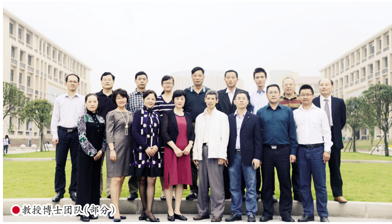
●教授博士团队(部分)