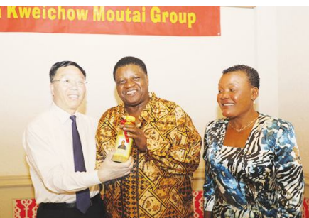
● 茅台集团党委书记、总经理李保芳向纳米比亚土地改革部长乌托尼夫赠送“走进非洲”贵州茅台纪念酒。

党的十九大后,茅台全面加速并优化全球布局。目前,茅台有 104 家海外经销商,分布于五大洲 66 个国家和地区,并在全球 50 多个国家重要免税口岸的 450 余家免税店有