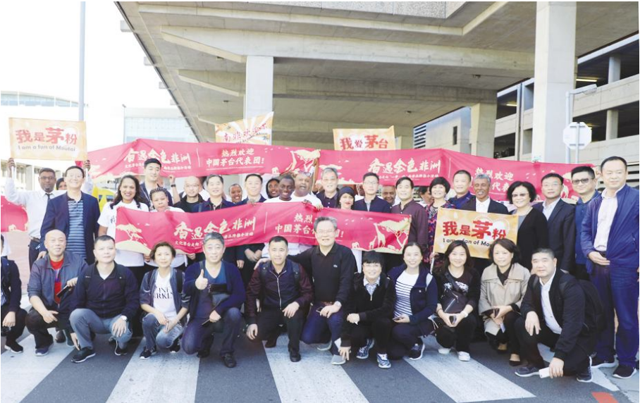
● “茅台推介团”成员在南非受到热烈欢迎。

此次南非推介活动结束后,茅台部分推介团成员还将考察纳米比亚和莫桑比克,并在莫桑比克马普托举行茅台援建当地卡腾贝小学奠基仪式。