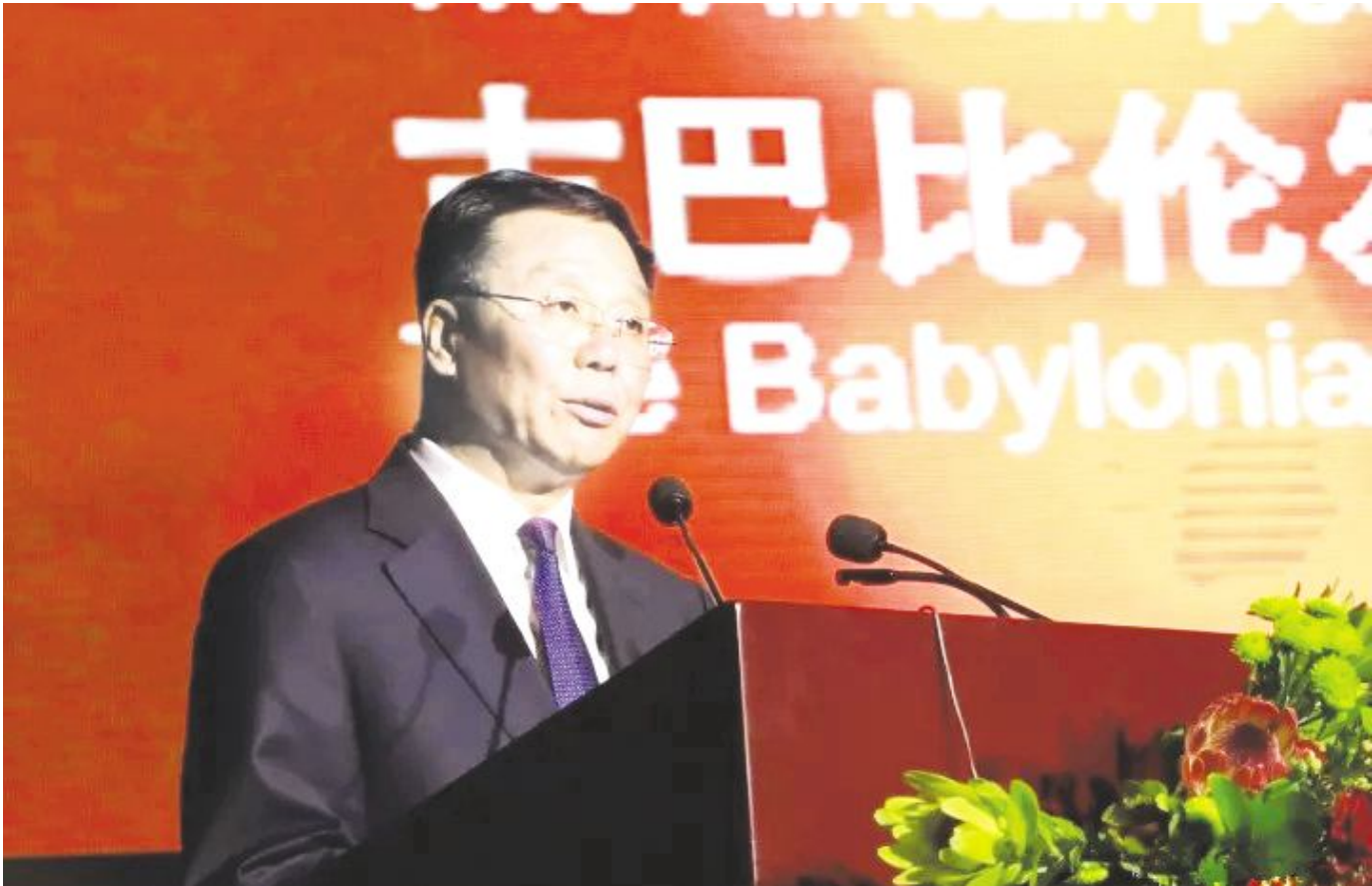
● 茅台集团党委书记、总经理李保芳在文化茅台走向“一带一路”品牌推介活动上致辞。

中国驻南非开普敦总领事康勇在致辞中高兴地说:“如今茅台已经出口至北美等全球各地,但对于非洲市场的探索仍处于初级阶段。因此茅台集团通过‘一带一路’的推介活