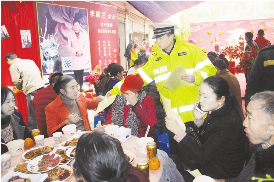
●剑阁交警积极深入老人寿宴开展酒驾宣传,通过发放宣传资料、宣讲酒后驾车危害、LED 播放“开车不饮酒，饮酒不开车”等提示语,不断加大对现场驾驶人员的提示和宣传,取得了明显的宣传效果。

一是充分发挥公安交警“主力军”作用，建立健全治酒驾工作台账，对酒驾治理始终坚持严管重罚的方针，定期错时上路面酒驾醉驾进行打击处理。二是每月组织召开联席会，培训各成员单位酒驾治理专兼职人员，曝光酒驾交通事故，指导各部门酒驾治理工作开展。三是建立酒驾治理工作考评机制，县酒驾整治办每年对其成员单位进行年度考核，