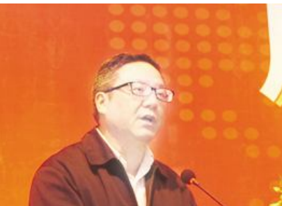
●武侯区人大常委会副主任唐恭学在会上讲话