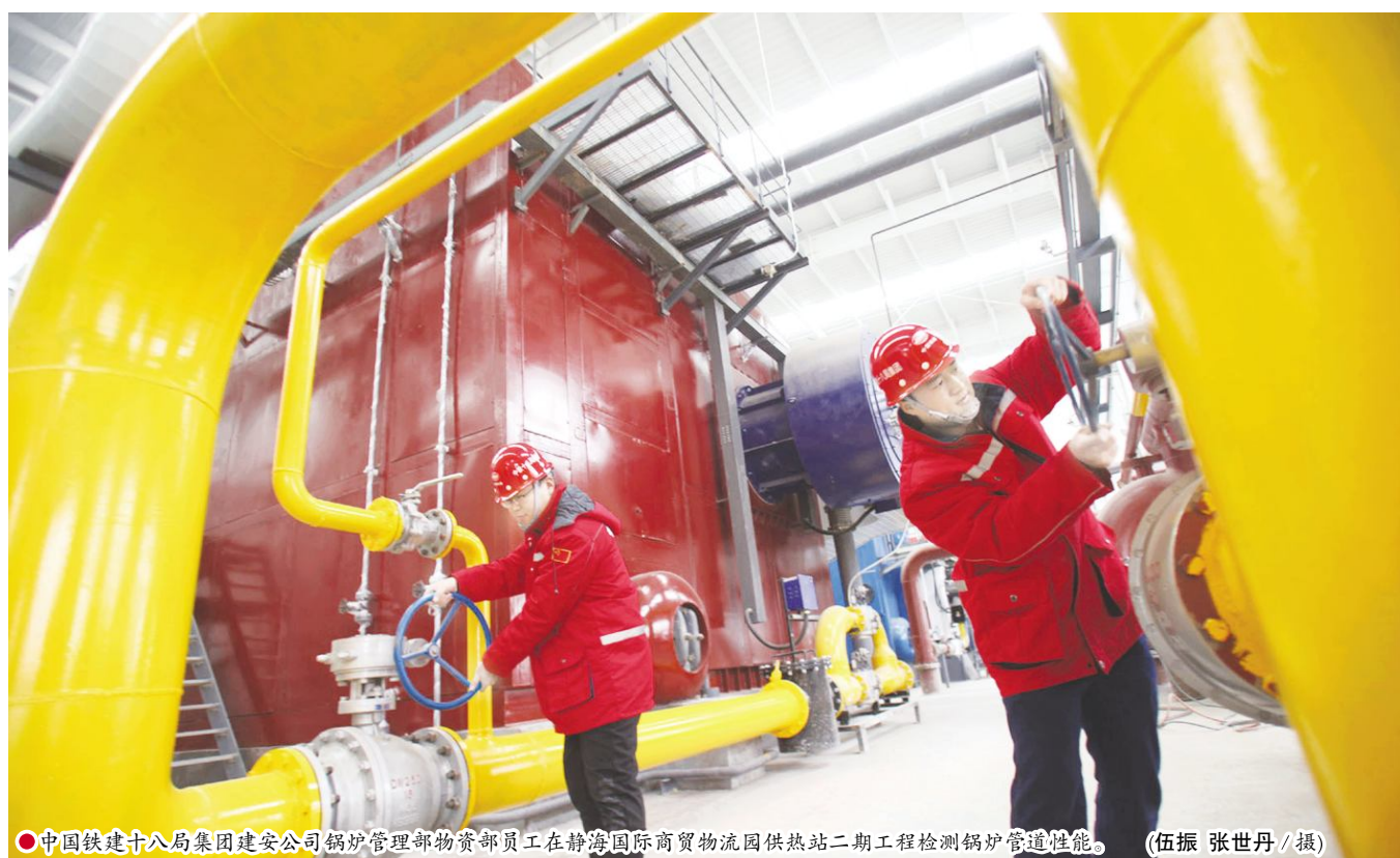
●中国铁建十八局集团建安公司锅炉管理部物资部员工在静海国际商贸物流园供热站二期工程检测锅炉管道性能。