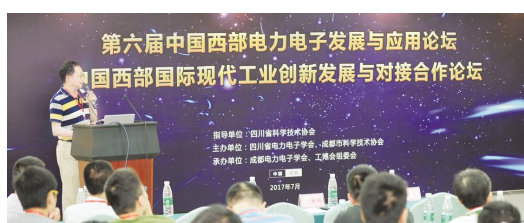
● 2017 成都工博会论坛现场