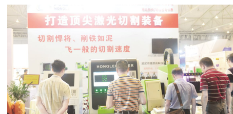
● 武汉鸿镭激光科技有限公司产品展示