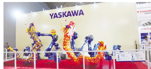
● 安川电机机器人产品展示