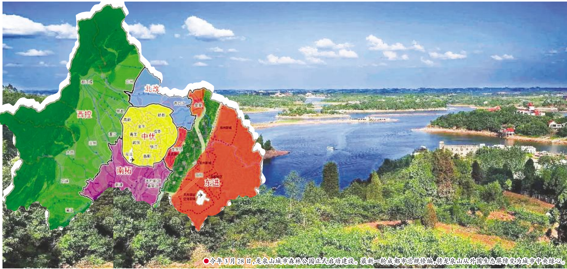
今年3月28日,龙泉山城市森林公园正式启动建设,新一轮成都市总体规划修编,将龙泉山从外围生态屏障变为城市中央绿心。