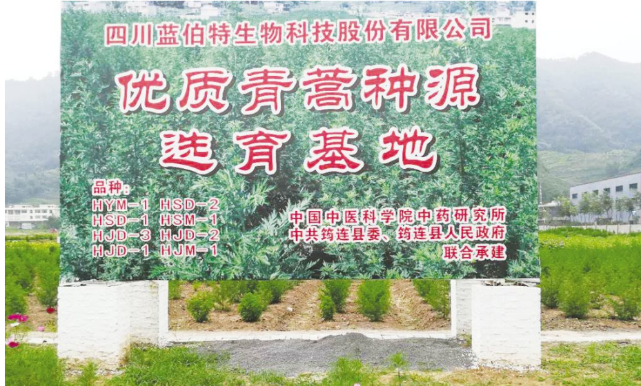
●优质青蒿种源选育基地

蓝伯特对青蒿素产业新的历史发展机遇期的战略进行深度谋划,与中国中医科学院中医研究所、四川大学、重庆理工大学和宜宾化学与化工学院等科研院所建立产学研合作,与广东新南方药业集团、广东罗浮山国药、江苏斯威森生物医药、上海迪赛诺药业等多家企业建立了全面的战略及市场合作关系,并收购药厂和通过全球基金组织严格的审查入选