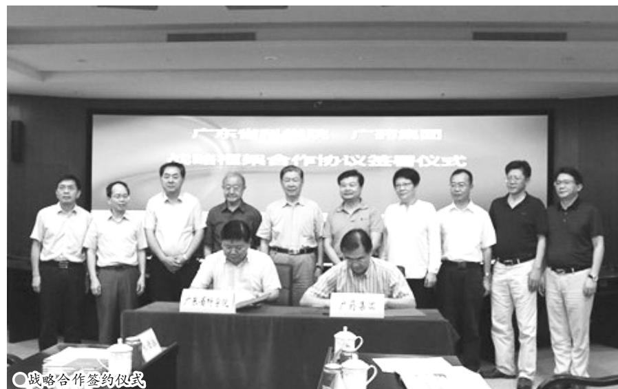
战略合作签约仪式

据了解，双方将瞄准广州 IAB 战略性新兴产业，重点围绕生物与健康领域开展深度协同创新，充分发挥广东省科学院的科技创新平台、高端创新人才、六大创新板块优势和广药集团强大产业化的市场化优势，在医药、医疗器械、大健康、生物资源等细分领域进行多维度